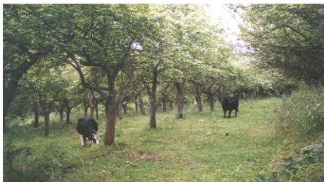
Fig. 2. Silvopastoral form of streuobst in White Carpathians - extensive fruit orchards with tree density usually between 50 and 200 trees·ha -1 grazed by sheep or cattle

Currently, to our knowledge, there are not practiced any modern agroforestry systems (e.g. alley cropping) for timber production yet; however, potential for production of quality timber (e.g. wild cherry, walnut) and wood biomass exists. Rapid development of short rotation coppice systems (based on willows and poplars for fuel biomass) during last decade also makes growing potential and interest in establishment of these systems in agroforestry schemes (e.g. in combination with timber trees or agricultural crops).