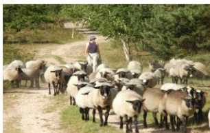
Fig. 1. Trees on pastures (forest pasture) – NP Podyjí, traditional historical land use management systems; now restarts for biodiversity conservation

Agroforestry has been practiced from the beginning of agriculture in whole Europe; however, currently it is not a common land use system in Czech Republic. Traditional agroforestry practically (Fig. 1) disappeared during the era of collective farming throughout of 20th century, except for small remnants and modern agroforestry systems are not in practice yet.