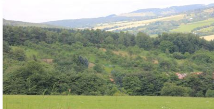
Fig. 3. Silvoarable streuobst - intercropping under fruit (apples, pears, plums and cherries) orchards - White Carpathians