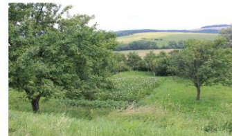
Fig. 6. Homegardens – hobby farming found in many regions of the Czech Republic