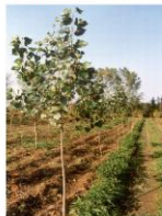
Fig. 5. Intercropping of poplar trees in forest lands – Zidlochovice region

We have no data about extension of above mentioned agroforestry systems , but it is rather insignificant. Now, there is a change in European and Czech agricultural policy leading to more environmentally friendly agricultural production, sustainability, rural development and biodiversity enhancement. This shift in agricultural policy that could also support tree growing on agricultural land, may foster agroforestry development, especially in organic farming and less favoured areas (e.g. mountains, protected landscapes).